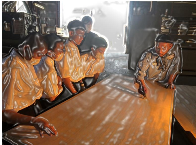
ベニヤ板の端を切る体験学習