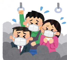
混雑した乗り物の中