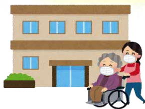
高齢者施設など に行くとき