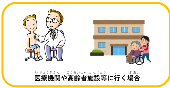
いりょうきかん こうれいしやしせつとう い ばあい 医療機関や高齢者施設等に行く場合