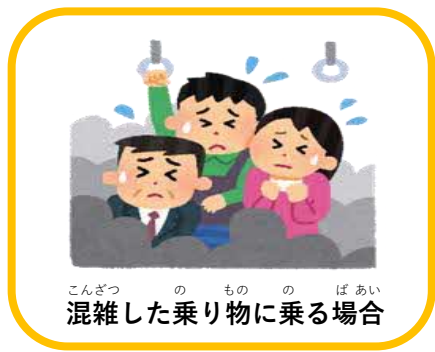
こんざつ の もの の ばあい 混雑した乗り物に乗る場合

ただし、つぎ ばあい ちやくよう すいしょう ただし、次のような場合は、マスクの着用が推奨されます。