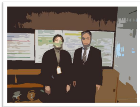
<吉里さんと校長先生>