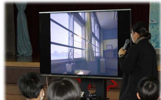
<生徒の撮った写真を講評>