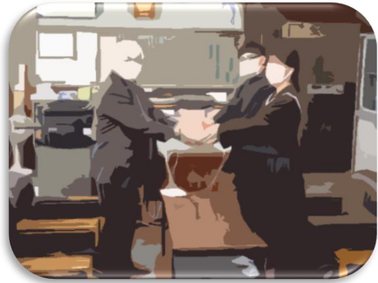
<生徒会から妹背牛町社会福祉協議会へ>

11月30日(水)～12月2日(金)まで、生徒会中心となって、赤い羽根共同募金の取組を行いました。朝の登校時に生徒玄関で活動したり、昼休みには職員室の先生方のところにも来たりして積極的に募金活動を行った結果、12,000円集まりました。集まったお金を有益に使ってもらえるようお願いし、妹背牛町社会福祉協議会にお渡ししました。