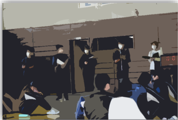
<主体となってすすめた生徒会のメンバー>