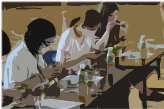
<体育館にて、コロナ対策をしながらの製作>