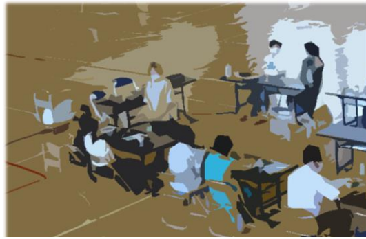
<中央は講師の先生>