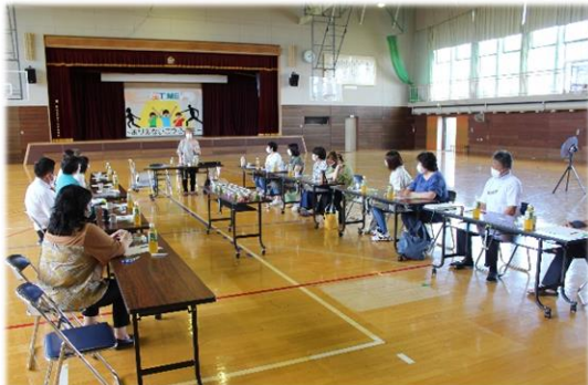
<中央は講師の先生>

最後に、ワイヤリング・テーピングした花材を土台に、自分の好きなようにバランスよく挿していきます。参加した15名の方たちは、ところどころ苦戦しながらも楽しく最後まで作業をしていました。できた作品については、学校祭の時に校内に展示する予定です。お楽しみに。参加した皆さん、お疲れ様でした。