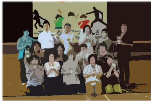
<制作後、参加者全員で記念撮影>