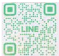
妹背牛温泉ペペル LINE QR コード