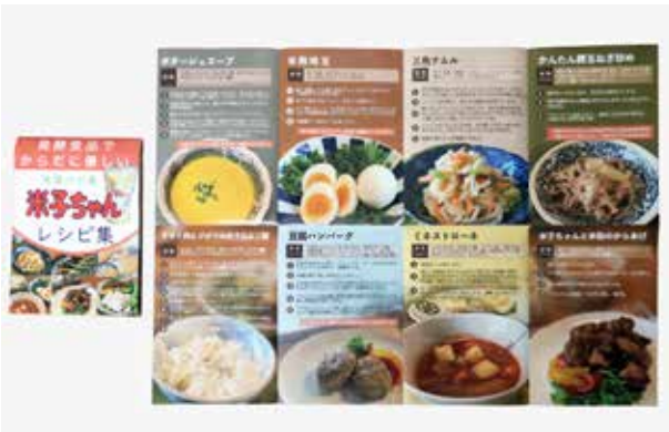
豆腐ハンバーグやポタージュスープなどの作り方を紹介したレシピ集

妹背牛産米を使った浅漬けの素「米子（よねこ）ちゃん」を製造・販売する二五八グループは、この米子ちゃんを活用したレシピ集（カラー版）を1,000部作成し、妹背牛温泉ペペルとフレッシュマーケットしんたに配布しています。 米子ちゃんは、「塩・こうじ・米」を二対五対八の割合で仕上げた無添加の二五八漬けの素。レシピ集には、10種類以上の料理の作り方を掲載しており、持ち運びしやすい手のひらサイズに折りたたまれています。