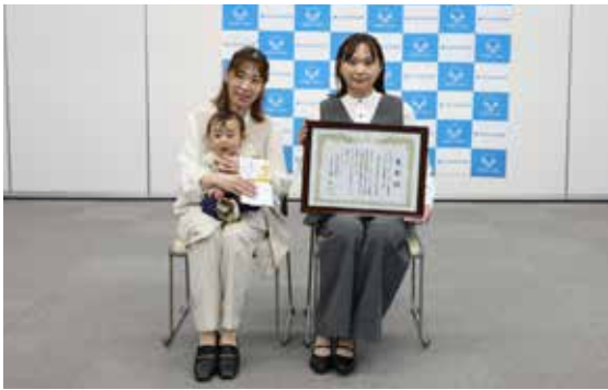
文化部門賞に選ばれた「とちのみ」のメンバー

北空知信用金庫の令和7年度「きたしん『ふるさと振興基金』」の受賞団体が決まり、妹背牛町内からは「わかち愛劇団」と「青空自主保育とちのみ」の2団体が文化部門賞に選ばれました。さらに「わかち愛劇団」は大賞も受賞しました。