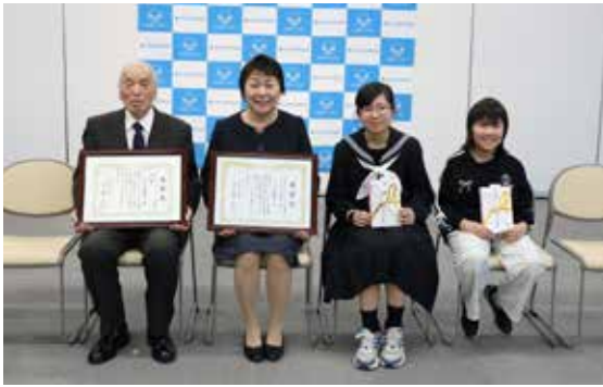
大賞に選ばれた「わかち愛劇団」のメンバー