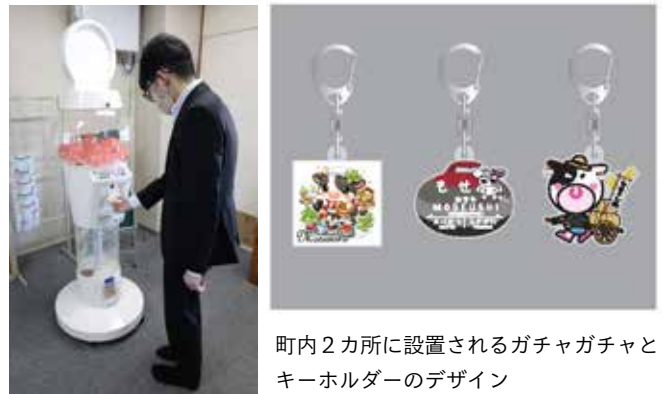
町内2カ所に設置されるガチャガチャとキーホルダーのデザイン

町のPRグッズとして、昨年12月の子ども議会で提案された「ガチャガチャ」が、5月に妹背牛温泉ペペルとカーリングホールの2カ所に設置されます。 自身はキーホルダー、マスキングテープ、消しゴムの3種類。町のキャラクター「ウッチー」や「あいもちゃん」などがデザインされており、それぞれ異なる絵柄を当てるワクワク感も楽しめそうです。価格は1回400円です。