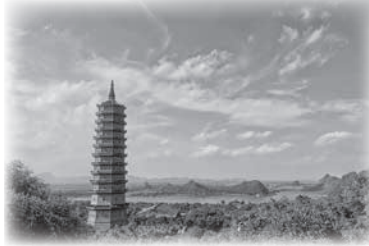
バイディン寺の写真

dựng vào năm 1136, từ năm 2003 chùa được mở rộng và tiếp tục cho đến ngày nay. 500 bức tượng Phật chào đón bạn trên những bậc thang dài dẫn đến chính điện. Mỗi bức tượng có một khuôn mặt, tư thế và ý nghĩa khác nhau. Một số người có sự tín ngưỡng sâu sắc vừa đi vừa chạm vào tất cả các bức tượng Phật và cầu nguyện. Trái với vẻ ngoài cổ kính, ngoài 3 pho tượng bằng đồng lớn nhất Việt Nam còn có nhiều tượng Phật tỏa sáng rực rỡ khác. Bái Đính không chỉ là một công trình đơn thuần mà qua đó bạn còn có thể hiểu một phần về tín ngưỡng tôn giáo và những khía cạnh mới của con người Việt Nam.