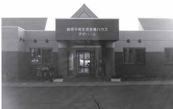
生活支援ハウスすまい・ル

雪寒機械増強事業、高規格救急自動車購入事業、生活支援ハウス改修事業の追加と、定住等促進事業の内容を変更するものであり、原案のとおり可決されました。